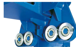
Ruedas de apoyo articuladas